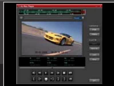
Scheduler + AsRun Browser